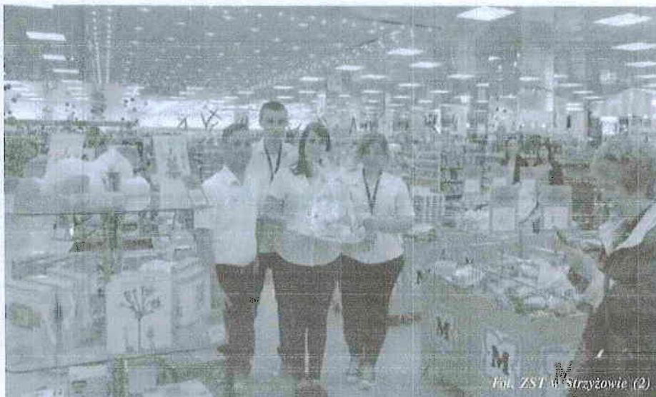
Fot. ZST w Strzyżowie (2)

liczyć na bezpłatne kursy przygotowujące do wyjazdu, transport do miejsca odbywania praktyk i z powrotem, zakwaterowanie, bilety na transport miejski, udział w wycieczkach edukacyjnych oraz wysokie kieszonkowe. Wszystkie te wydatki pokrywane są oczywiście z funduszy unijnych.