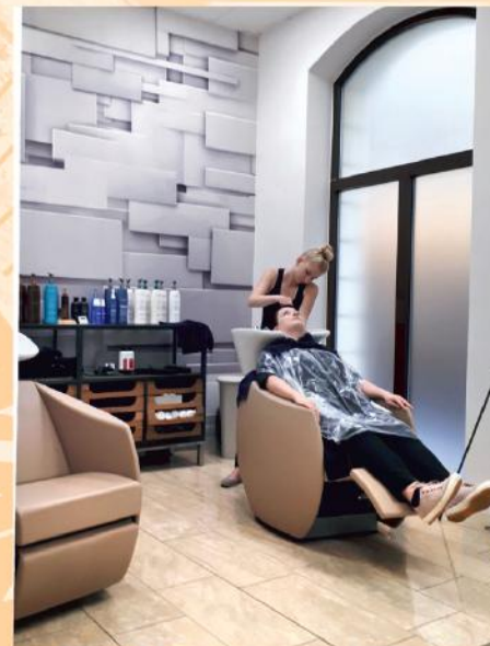
Uczniowie naszej szkoły w czasie praktyk zawodowych w popularnych niemieckich przedsiębiorstwach.